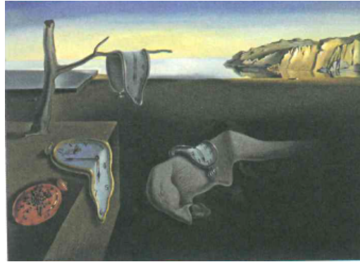
Resim 3. Salvador Dali, Belleğin Azmi, 1931. Tuval üstüne yağlıboya, 24 x 33 cm.

Joan Miro'nun "Tavşanlı ve Çiçekli Manzara" adlı "Bu resimde Miro her renk alanına kendine özgü bir yaratık yerleştirilmiştir. Miro, mavi alana aydınlatılmış yumurta dediği, ince iplerle yeryüzüne bağlanmış cisim kırmızı alana ise tavşan başı mantıksız bir şekilde dediği şekli koymuştur" (Thompson, 2014: 177). Miro sıcak ve soğuk renkleri yan yana koyarak bir kontrastlık sağlamıştı. Miro farklı nesnelere gelişigüzel tabloya koyarken bu nesnelere farklı anlamlar da yükler. Artık nesnelere fenomenal anlamlarının dışındadır.