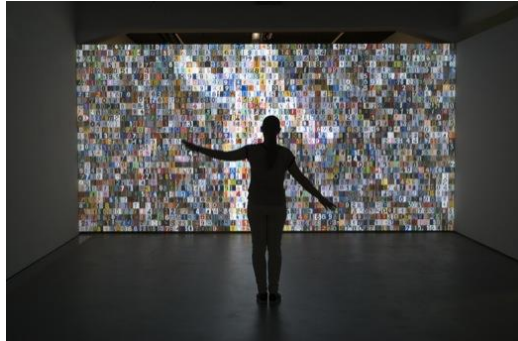
Görsel 1. Rafael Lozano-Hemmer, "1984x1984, Shadow Box 10", 2015

Birçok çağdaş sanatçı ve tasarımcı, bilgisayara sanatsal bir araç olarak bakıyor ve kendi dijital kurulumlarını yapıyor. Sergileri ziyaret etmenin yanı sıra, kalıcı etkileşimli enstalasyonların olduğu dijital sanat için özel olarak oluşturulmuş müzelere Japonya, Tokyo'daki Dijital Sanat Müzesi - Mori: dünyanın ilk dijital sanat müzesi ilan edilen teamLab Borderless örnek verilebilir.