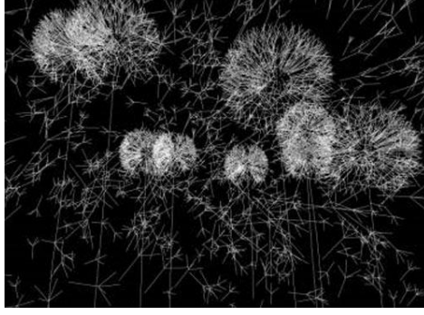
Görsel 5. Couchot Edmont/Bret Michel, "I Sow to the Four Winds" 1990 https://www.dataisnature.com/?p=285

Dijital enstalasyonlar, gelenekleri ve rutinleri baltalar. Genellikle ilk görünüm, nesnenin tek biçimi değildir. Nesnelere veya özneler, nesnenin zamanla geçirdiği süreçler önemlidir. Dijital enstalasyon sanatının birçok eseri, zamansallık fikrini ifade eder, malzeme, bir süreci gözlemlemek için bir araç haline gelir. Sanatçı, istenilen ifadeyi elde etmek için eseri veya eserini değiştirebilir.