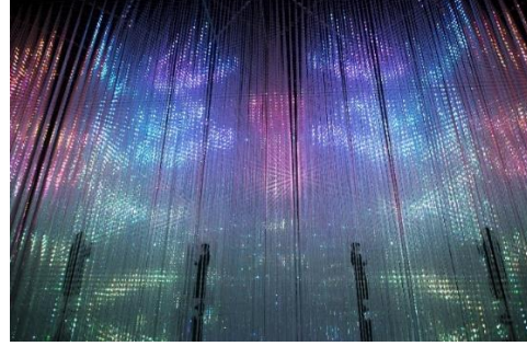
Görsel 6-7. https://www.teamlab.art/e/cubicshower_shanghai/ , https://borderless.teamlab.art/ew/crystalworld/