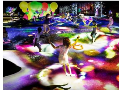
Görsel 2-3-4. teamLabExhibition view, MORI Building Digital Art Museum: teamLab Borderless, 2018 https://www.kyushuandtokyo.org/spot_183/

Uluslararası kültürlerdeki değişiklikler, yeni sanatsal formların üretilmesine yol açtı. Sanat o zamana kadar ulaşamadığı yerlere ve sosyal alanlara ulaştı. İzleyicinin meydana gelen esere 'daldırılması' tüm duyularını kullanması istendi. farklı disiplinler ve alanlarda, sanatın açık bir biçimi olarak enstalasyon doğdu (Oliveira vd, 1997). Seçilmiş ilişkiler öğelerin, kavramların, anlamların ve duyuşal deneyimin ardışık gerçekleşmelerdeki yeni yorumlara uğrayan zihinsel ve yapısal sistem oluştu.