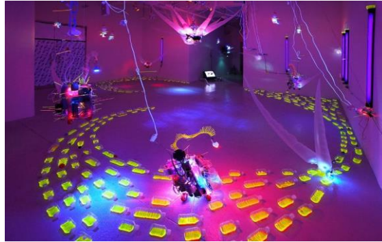
Görsel 11. Shih-Chieh Huang, "Nocturne", 2011 https://www.designboom.com/art/shih-chieh-huang-incubate-exhibition-feldman-gallery-/

İzleyicinin çevre ile ilişkisi ve çevre algısı olmadan var olmayışı estetik değeri yaratan, algılanan ile algılayan arasındaki ilişkinin niteliğidir. "Bu doğrultuda algılama sürecinin doğasında izleyici ile nesne arasındaki ilişki ve hareket bulunduğunu varsayar ki bu aynı zamanda da anlamın üretimidir. İnsan her algılamada mekana hâkim olmakta ve kendi dünyasını yeniden yaratmaktadır. Bu bağlamda, estetik anlam yaratan ve anlamla sonlanan algıdır. Bu anlam her zaman, zaman ve mekân içinde yaşamakla ilgilidir. Bu durumda da mekân sanata adanmış bir alan haline gelmektedir" (Ögel, 1977).