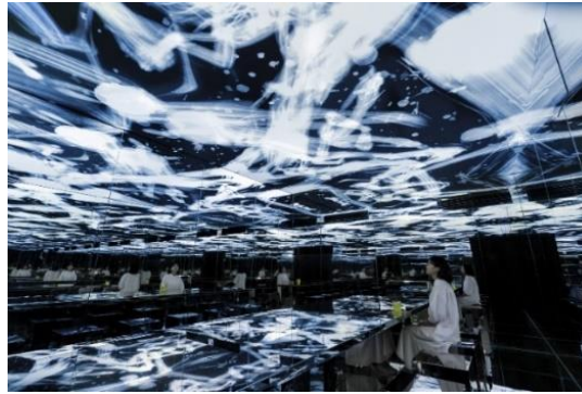
Görsel 8. teamLab, Digital Installation, "Non-Objective Space, 2021 https://planets.teamlab.art/tokyo/ew/reversiblerotation_nonobjective/

Dijital sanat enstalasyonları, izleyicilere sanat eserine aktif olarak katılmaları için yeni fırsatlar sunuyor. Sanatçılar ve tasarımcılar, izleyici veya "kullanıcı" ile dijital boyut arasındaki "gerçek-sanal" sınırla oynama fırsatına sahiptir. Dokunma, fiziksel katılım ve sosyal etkileşim temel nitelikler haline gelir. teamLab, dijital teknoloji kullanarak yaratılan sanat, aynı alanda bulunan insanlar arasındaki ilişkileri değiştirme yeteneğine sahip diyor. Şimdiye kadar sanatın çoğunluğu için diğer izleyicilerin varlığı bir engel oluşturmuştu. Ancak dijital teknoloji kullanarak yapılan bir sanat eseri, ziyaretçilerin varlığına veya davranışlarına göre değiştiğinde, sanat eseri ile ziyaretçi arasındaki sınırların bulanıklaşmasına neden olur. Bu durumda ziyaretçi sanat eserinin bir parçası olur.