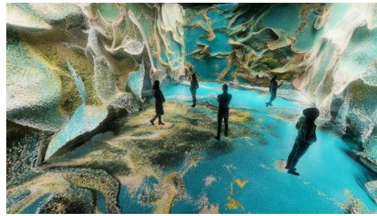
Görsel 13-14. Refik Anadol, "Machine Memoirs: Space", İstanbul, 2021