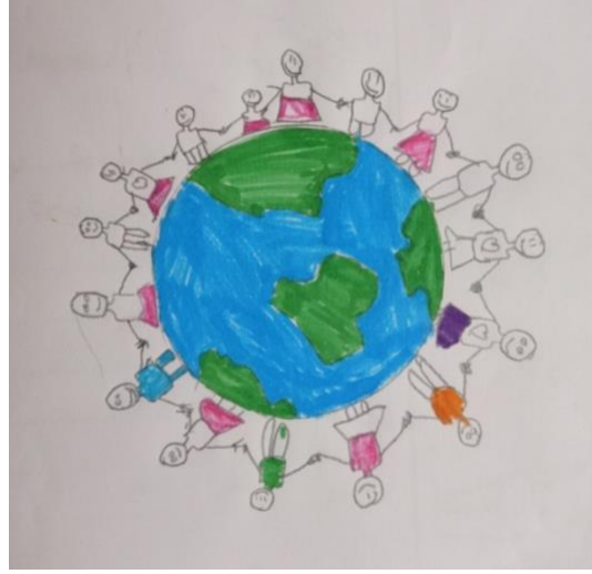
Resim 1. Rabiya'nın resmi "Sevgi"

Resim 1 incelendiğinde Rabiya'nın dünya üzerindeki çocuklar ile sevgi kavramını ilişkilendirildiği görülmektedir. Rabiya oluşturduğu sevgi kavramına uygun olarak üç gösterge türünü de kullanarak çizimini tamamlamıştır. Çizilen resimde Rabiya " Sevgi dünyayı coşturur, çocukları neşelendirir. " demiştir. Resimde dünya ve çocuklar görüntüsel göstergeyi, çocukların yüz ifadeleri mutluluğu ve sevgiyi ifade ettiği için belirtiyi, çocuklar üzerindeki kalpler simgeyi ifade etmiştir.