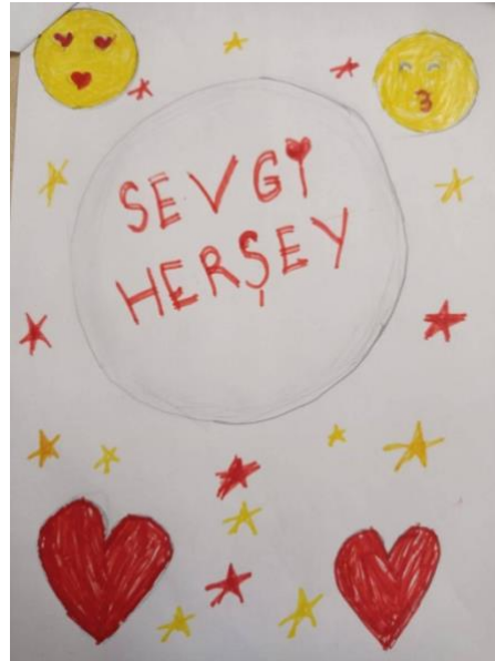
Resim 4. Baran'nın resmi "Sevgi"

Resim 3 incelendiğinde Zehra gösterge türünden görüntüsel gösterge ve simgeyi kullanmıştır. Zehra çizdiği resim için düşüncesini " Sevgi benim için bir ağacı simgelediği için böyle bir ağaç çalışması yaptım. " şeklinde ifade etmiştir. Resim incelendiğinde görüntüsel gösterge olarak ağaç görülmektedir. Simge olarak ise sevgiyi işaret eden kalpler bulunmaktadır.