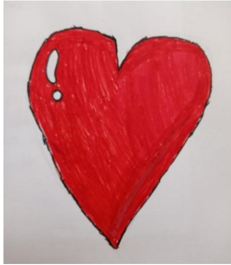
Resim 2. Berra'nın resmi "Sevgi"

Resim 1 incelendiğinde Rabiya'nın dünya üzerindeki çocuklar ile sevgi kavramını ilişkilendirildiği görülmektedir. Rabiya oluşturduğu sevgi kavramına uygun olarak üç gösterge türünü de kullanarak çizimini tamamlamıştır. Çizilen resimde Rabiya " Sevgi dünyayı coşturur, çocukları neşelendirir. " demiştir. Resimde dünya ve çocuklar görüntüsel göstergeyi, çocukların yüz ifadeleri mutluluğu ve sevgiyi ifade ettiği için belirtiyi, çocuklar üzerindeki kalpler simgeyi ifade etmiştir.