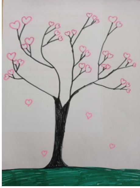
Resim 3. Zehra'nın resmi "Sevgi"

Resim 3 incelendiğinde Zehra gösterge türünden görüntüsel gösterge ve simgeyi kullanmıştır. Zehra çizdiği resim için düşüncesini " Sevgi benim için bir ağacı simgelediği için böyle bir ağaç çalışması yaptım. " şeklinde ifade etmiştir. Resim incelendiğinde görüntüsel gösterge olarak ağaç görülmektedir. Simge olarak ise sevgiyi işaret eden kalpler bulunmaktadır.